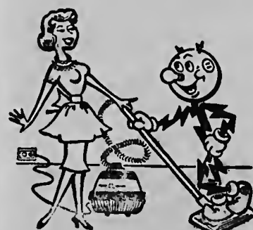
Stofzuger moderno y eficiente obtenibel na e mihor tiendaan.

Senjora; Mientras bo por conta cu yudanza di Reddy bo trabounan di cas ta keda cla rapidamente.